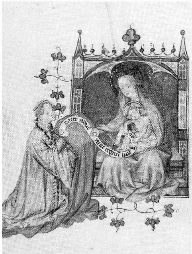
Schenkster voor Madonna. Lissabon, Museo Calouste Gulbenkian, Ms. L.A. 148, fol. 19v. Te zien in Utrecht.

LONDEN The British Library: The Dutch and their Books in the Manuscript Age. November 1989. In aansluiting bij the 'Panizzi Lectures in bibliography 1989' georganiseerd - zie onder VARIA.