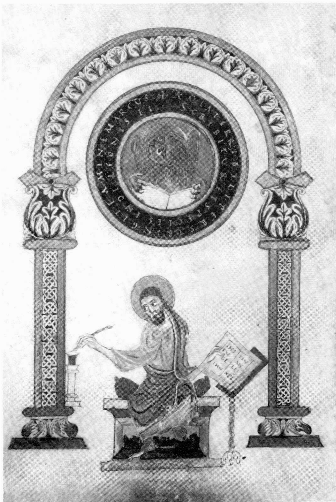
De evangelist Marcus. Schnütgen-Museum, Keulen, Ms. G 531, fol. 62v. Saint-Amand, ca 860-880. Te zien in 's-Gravenhage.