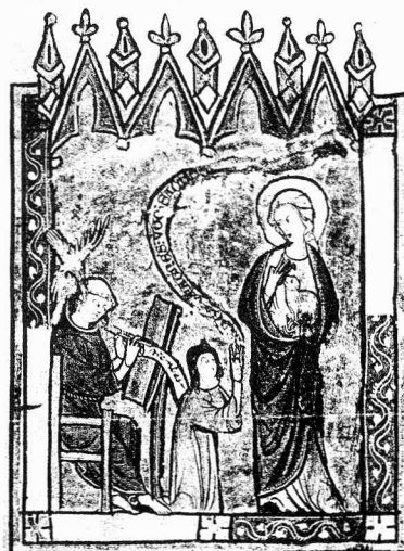
Maastrandse miniatuur, te zien in Sint Truiden.

De NAVE, F. & L. VOET Museum Plantin-Moretus Antwerpen . Brussel: Cultura Nostra, 1989. 128 pp., rijk geïll., deel in kleur. BF 595 ingenaaid, BF 950 gebonden.